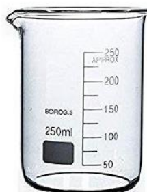
Bêcher 250 mL