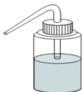
Pissette d'eau minérale