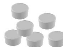
Comprimés de vitamine C