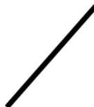
Agitateur en verre