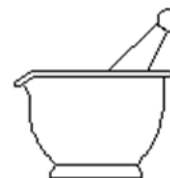
Mortier et pilon